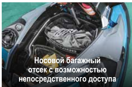
Носовой багажный отсек с возможностью непосредственного доступа

Просторный отсек для хранения в носовой части: удобно использовать, не вставая с гидроцикла. 1