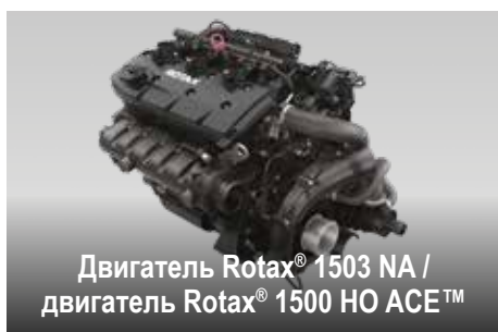
Двигатель Rotax® 1503 NA / двигатель Rotax® 1500 HO ACE™

Не имеющая аналогов в отрасли, устанавливаемая на заводе, действительно водонепроницаемая аудиосистема с модулем Bluetooth. 2 Стандартная опция для GTX 230. (Дополнительное оборудование для GTX 155)