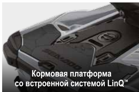
Кормовая платформа со встроенной системой LinQ™

Просторный отсек для хранения в носовой части: удобно использовать, не вставая с гидроцикла. 1