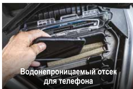
Водонепроницаемый отсек для телефона

Двигатель Rotax® 1503 NA позволяет мгновенно набирать скорость для максимального веселья. Модель 1500 HO ACE™ снабжена мощной системой наддува и усовершенствованной технологией сжигания топлива (ACE).